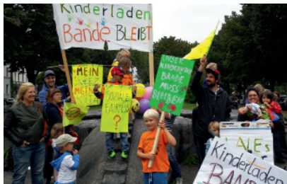
Elterninitiative und Kinderladen Bande e.V.